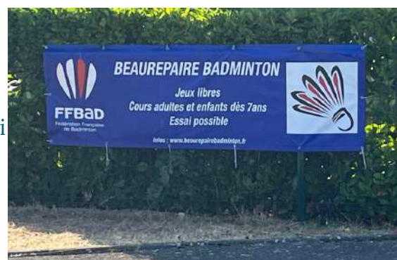
Vu sur les routes

https://www.beaurepaire-badminton.fr/inscription/