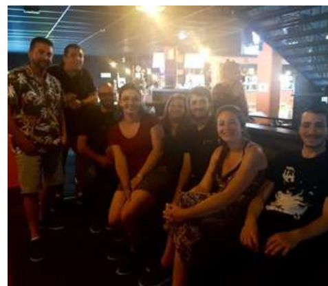
Equipe 2 2022/2023 en pleine élaboration stratégique